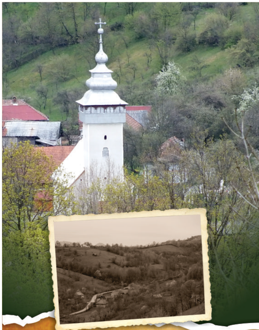
Proiectul Educațional Județean "A fost odată..." Brașov 2014